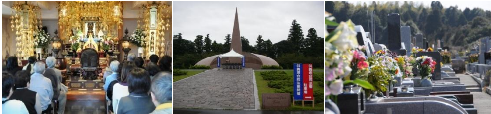
彼岸会スケジュール表